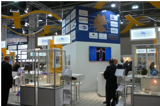
Beispiel – LASER 2015