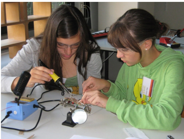
Herausforderungen im Labor des Konstanzer Physik-Camps

In den Pfingst- und Sommerferien veranstaltet die Universität Konstanz das 6-tägige Konstanzer-Physik-Camp für Schülerinnen der 8. bis 10. Klasse des Gymnasiums oder der Realschule. Vormittags tüfteln sie im Labor an spannenden Versuchen und nachmittags entdecken sie gemeinsam mit den anderen Teilnehmerinnen physikalische Grenzen im Hochseilgarten oder beim Floßbau. Beim Lagerfeuer am Bodensee entdecken sie mit Hilfe der Astrophysik die Sterne am Himmel und können sich mit Studentinnen und Doktorandinnen der Physik austauschen. http://cms.uni-konstanz.de/physik/dekorsy/lehre/schuelerinnen-forschen/